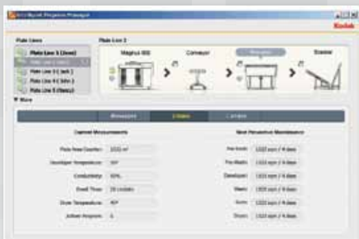
Lo schermo a comparsa IPM 2.0 viene visualizzato solo quando è necessaria una notifica. Questo schermo visualizza i dettagli relativi alle sviluppatrici in linea.