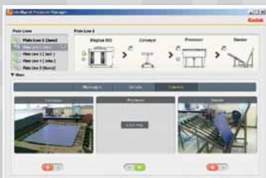
Questo schermo visualizza i dettagli online della videocamera.