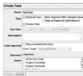
Creazione e assegnazione delle attività ai singoli responsabili

integrazione con Kodak InSite Asset Library , un sistema di gestione dei contenuti digitali, e Kodak InSite Prepress Portal , un toolkit per l'inoltro online dei lavori, garantisce un flusso di lavoro completo per la gestione del ciclo di vita della comunicazione grafica, l'approvazione dei contenuti e la consegna del lavoro. Con il flusso di lavoro Kodak Prinergy , gli addetti del settore delle comunicazioni grafiche possono avvalersi dei vantaggi di integrazione nel ciclo di produzione, fornendo ai sistemi CTP, ai sistemi digitali e ai sistemi inkjet di nuova generazione file affidabili e accurati.